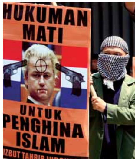
Jakarta, 1 april. Protest tegen film Wilders

Kort na de cartooncrisis in 2006 concludeerden twee Deense journalisten in een evaluatie in de krant Jyllands-Posten dat de islamisten 'voor driekwart' hadden verloren. Hun gewelddadige reacties op de publicatie van de tekeningen hadden immers niet geresulteerd in westerse excuses en evenmin in een andere omgang met islamitische symbolen. Maar de radicalo's hadden ook 'voor een